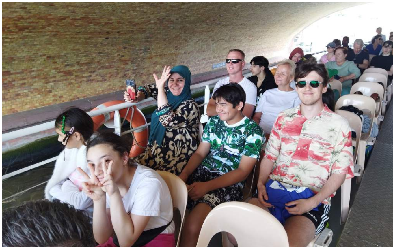
Zadanie publiczne "Rodzina bez granic" dofinansowane ze środków z budżetu Województwa Mazowieckiego.