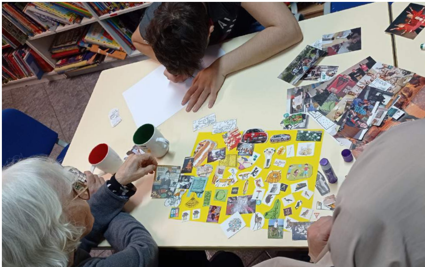
Zadanie publiczne "Rodzina bez granic" dofinansowane ze środków z budżetu Województwa Mazowieckiego.