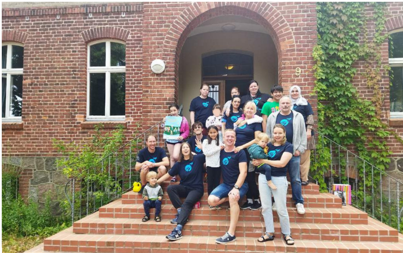
Zadanie publiczne "Rodzina bez granic" dofinansowane ze środków z budżetu Województwa Mazowieckiego.